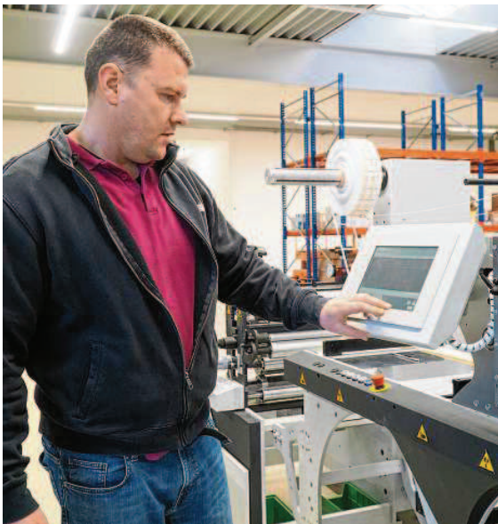
Die hohe fachliche Kompetenz aller Mitarbeiter macht es möglich, auch Nischenaufträge auszuführen.