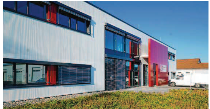
Nach einjähriger Bauzeit bezieht die Firma Valentini im Dauchinger Gewerbegebiet Riesenburg ihren Neubau. Hier soll künftig die Etikettenproduktion stattfinden, zusätzlich findet man in Dauchingen auch eine eigene Serviceabteilung.