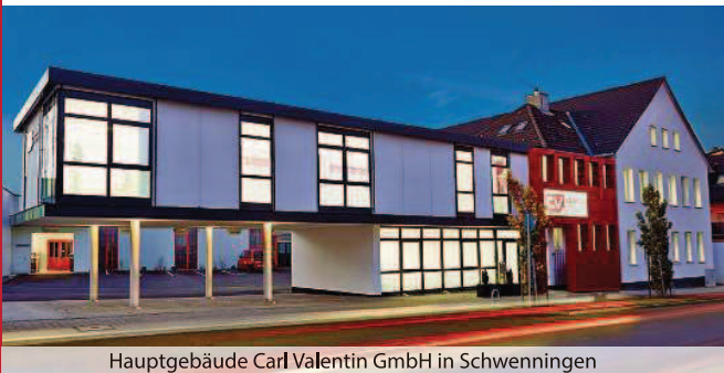
Hauptgebäude Carl Valentini GmbH in Schwenningen

Wir entwickeln Thermotransferdruck-Komplettsysteme