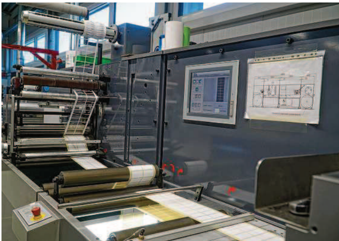
Innovation wird groß geschrieben bei CV Valentin. Alle Maschinen stammen aus eigener Entwicklung und Fertigung.