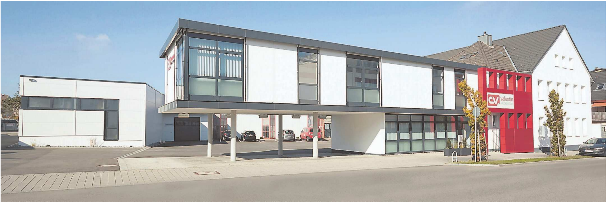
Die von Architekt Steffen Halder geplanten Anbauten der Firma Carl Valentin wurden modern und transparent gestaltet.