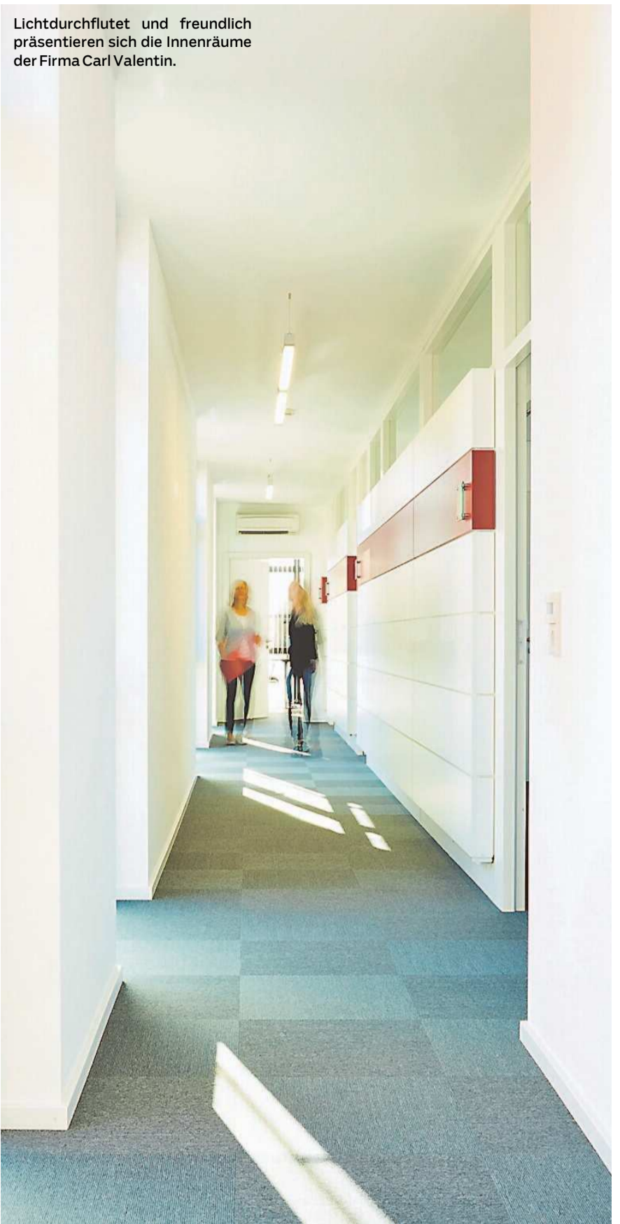
Lichtdurchflutet und freundlich präsentieren sich die Innenräume der Firma Carl Valentin.