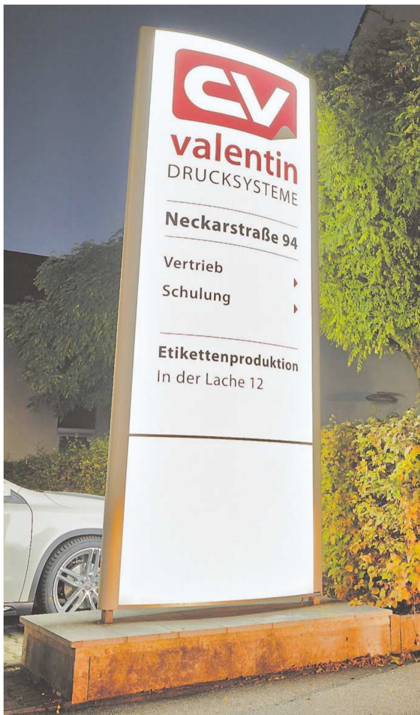
Auch in der Nacht überzeugt das Carl-Valentin-Betriebsgelände mit seiner neuen, eindrucksvollen Architektur.