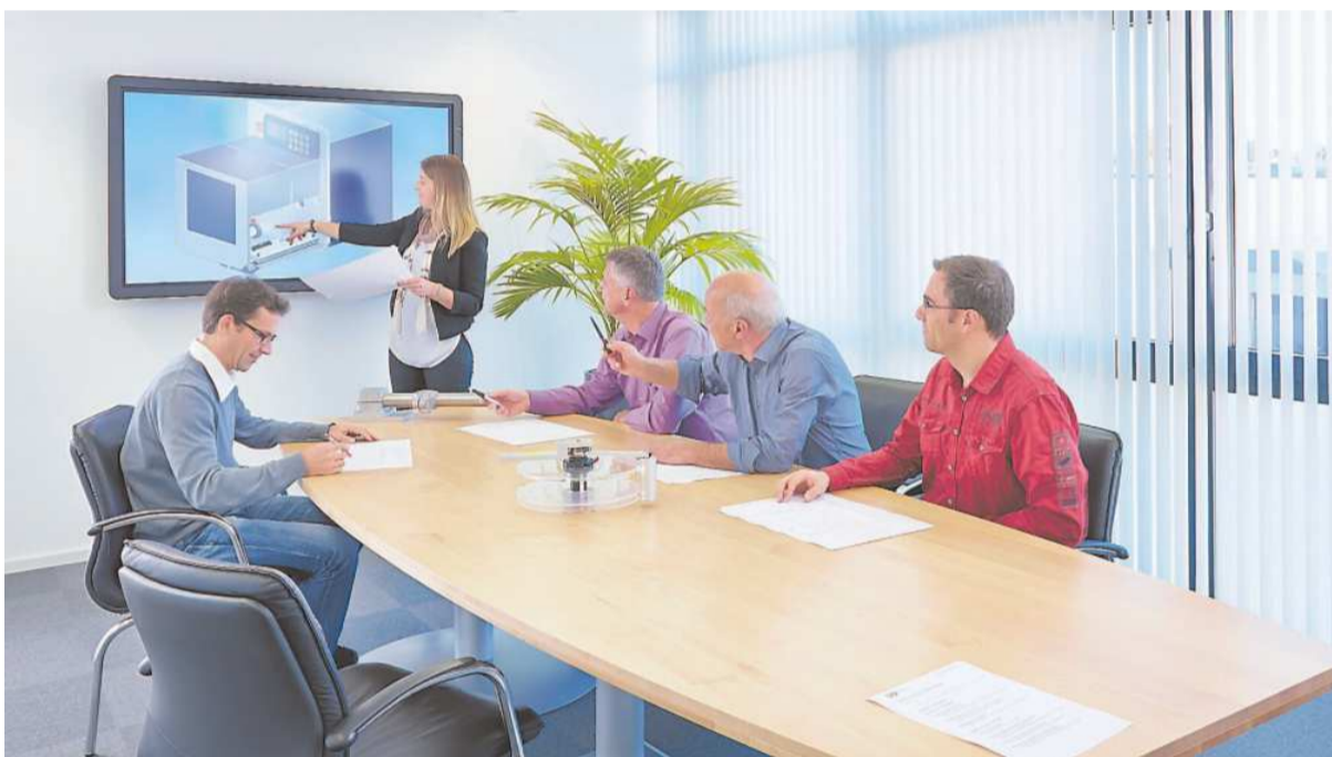
Auch die neuen Besprechungsräume überzeugen mit ihrer klaren Atmosphäre.

Schwenningen oder vor Ort. Zudem bietet das Unternehmen kundenspezifische Softwareanpassungen und -Updates. Darüber hinaus verfügt Carl Valentin über ein weltweites Netz an zuverlässigen Handelspartnern und Vertriebsbüros in Bayern, der Schweiz, Spanien und seit einem halben Jahr auch in Griechenland.